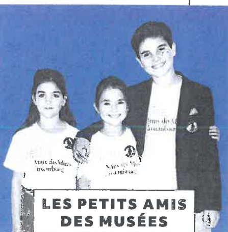
LES PETITS AMIS DES MUSÉES