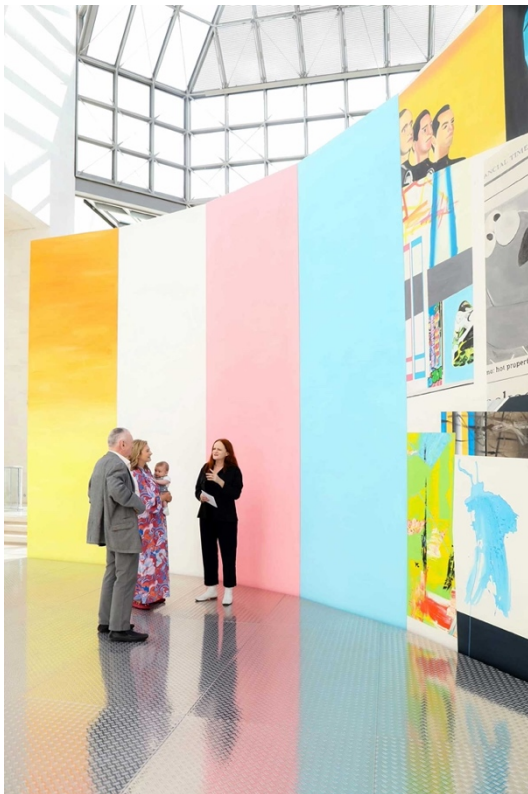
Premier engagement officiel dans un musée avec sa maman pour le prince François

Ce vendredi 15 septembre, Stéphanie de Luxembourg a visité l'un de ses musées préférés. Elle s'est rendue au MUDAM, le musée d'art moderne du Luxembourg. La grande-duchesse héritière Stéphanie n'a pas effectué cette visite seule. Elle avait pris avec son deuxième fils, le prince François. Le prince Charles, son aîné qui a fêté ses 3 ans en mai, est déjà habitué aux sorties culturelles de sa maman. À présent, c'est au tour du prince François d'être initié à l'art contemporain. Le prince François, né le 27 mars 2023, aura seulement 6 mois dans une dizaine de jours.