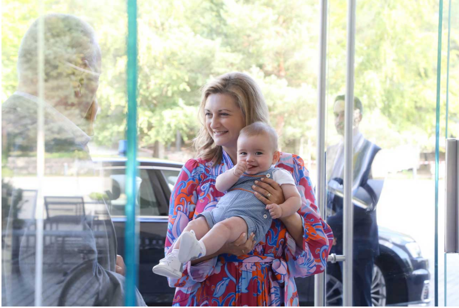
Le prince François nous gratifie d'un beau sourire à son arrivée au MUDAM