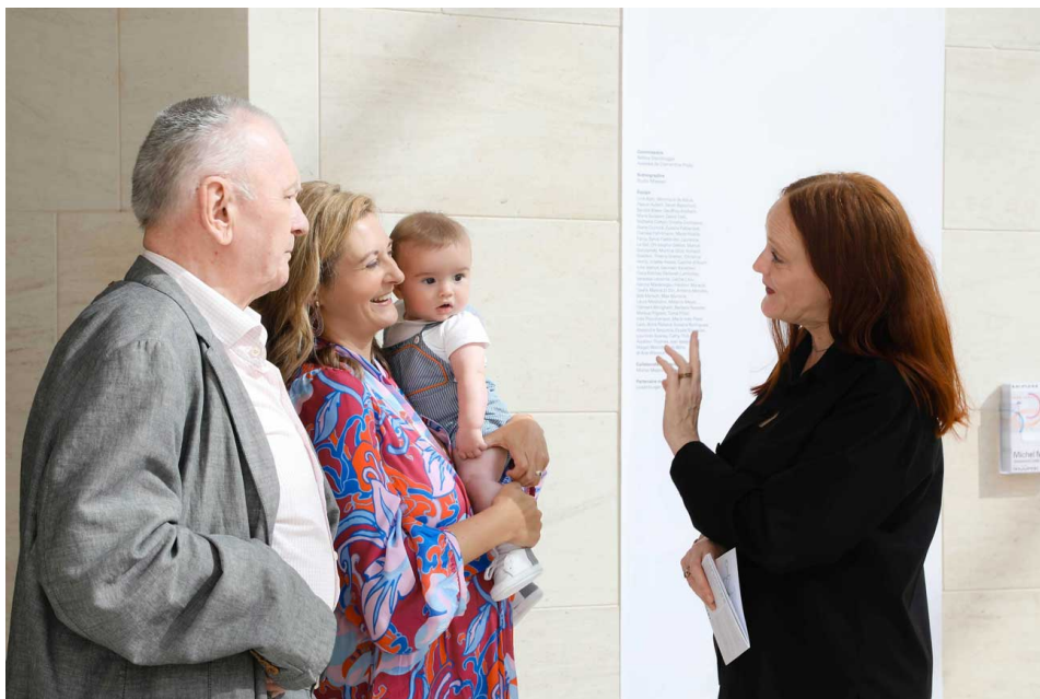
Stéphanie et François de Luxembourg visitent l'exposition avec le père de l'artiste Visite de l'exposition colorée de Michel Majerus avec Stéphanie et François de Luxembourg

Passionné d'art, Stéphanie a réalisé une thèse de fin d'étude sur l'influence du romantisme allemand sur le romantisme russe. Elle assure aussi le haut patronage de l'association les Amis des Musées Luxembourg depuis 2013.